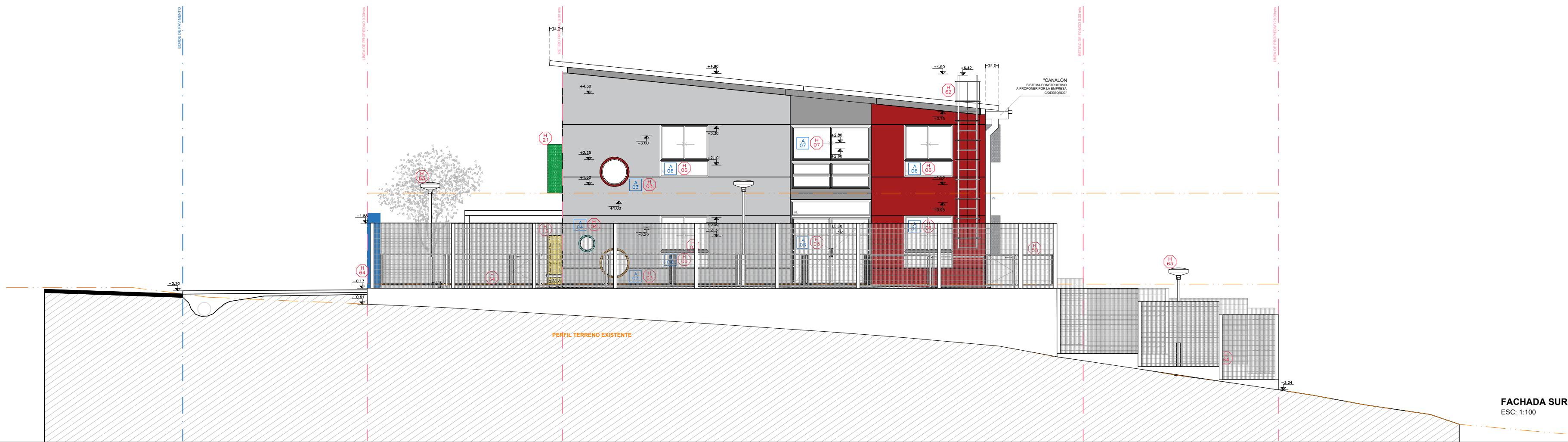
FACHADA SUROESTE ESC: 1:100